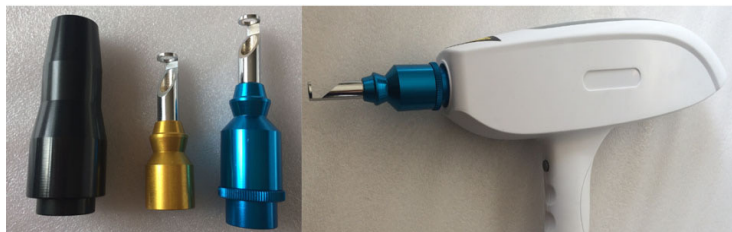
GŁOWICA ND:YAG Z FILTRAMI: 532, 1064, 1320 nm

Głowica emituje światło lasera o energii regulowanej od 10 do 1000 mJ i czasie emisji 10 ns. Głowica laserowa posiada wbudowaną czerwoną diodę, która naprowadza wiązkę lasera na punkty zabiegowe.